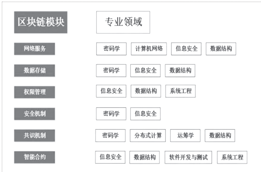
图1 区块链模块与专业领域的对应关系

区块链是一门跨学科、跨领域的技术应用，是一个综合性的系统，由网络服务、数据存储、权限管理、安全机制、共识机制、智能合约等模块共同组成。如下图1所示，列举区块链技术所涉及的技术模块包括智能合约、共识机制、安全机制、权限管理、数据储存、网络服务等。主要专业领域包括密码学、数据结构、计算机网络、分布式计算、运筹学、信息安全、软件开发与测试、系统工程等。本标准将在现有学科背景的教学标准和人才培养的基础上，结合区块链的技术特性，提出区块链技术人才培养的具体方案和內容。以下将详细阐述每个专业领域的知识构成和人才所应具备的能力。